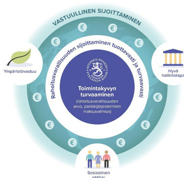
Kuva 1. Vastuullinen sijoittaminen

Keskuspankin vastuullisuus lähtee sen ydintoiminnasta. Toiminta-ajatuksemme pohjautuu taloudellisen vakauden rakentamiseen ja sitä kautta ihmisten hyvinvoinnin edistämiseen. Suomen Pankin vuonna 2019 käyttöön ottaman vastuullisuusohjelman yksi painopisteistä on ilmatoriskien hallinta. Sijoittamalla vastuullisesti Pankki antaa myös panoksensa ilmastotyöhön. Olemme julkisesti sitoutuneet liittämään ympäristöön, sosiaaliseen vastuuseen ja hyvään hallintotapaan liittyvät tekijät osaksi sijoituspäätösten tekoa ja omistajakäytäntöjä allekirjoitettuamme YK:n tukemat vastuullisen sijoittamisen periaatteet (PRI) joulukuussa 2019. Periaatteiden allekirjoittaminen tarkoittaa sitä, että rahoitusvarallisuuden hallinnassa olemme sitoutuneet vastuullisuuteen, kehitämme vastuullisen sijoitustoiminnan käytäntöjä aktiivisesti ja raportoimme edistymisestä vuosittain. Vastuullinen sijoittaminen ei heikennä pankin tekemien sijoitusten tuotto-riskisuhdetta.